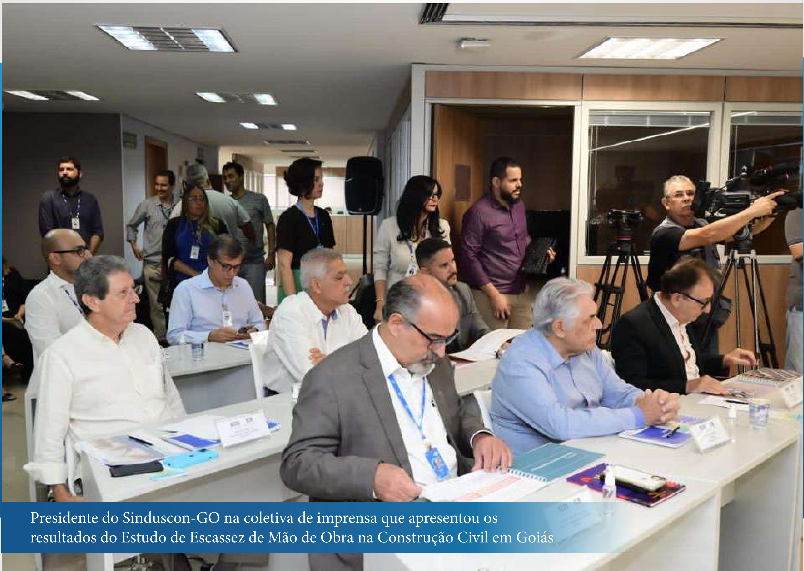
Presidente do Sinduscon-GO na coletiva de imprensa que apresentou os resultados do Estudo de Escassez de Mão de Obra na Construção Civil em Goiás

No dia 1º de março, o presidente da Fieg, Sandro Mabel, concedeu coletiva de imprensa para apresentar os resultados do Estudo de Escassez de Mão de Obra na Construção Civil em Goiás. De acordo com o presidente, o objetivo é ajudar as empresas do segmento a entender melhor e a lidar de forma assertiva com o problema. A partir dos dados coletados, foi avaliado o desempenho das atividades do setor e os gargalos, sendo identificado como principal vilão a concentração de trabalhadores na informalidade.