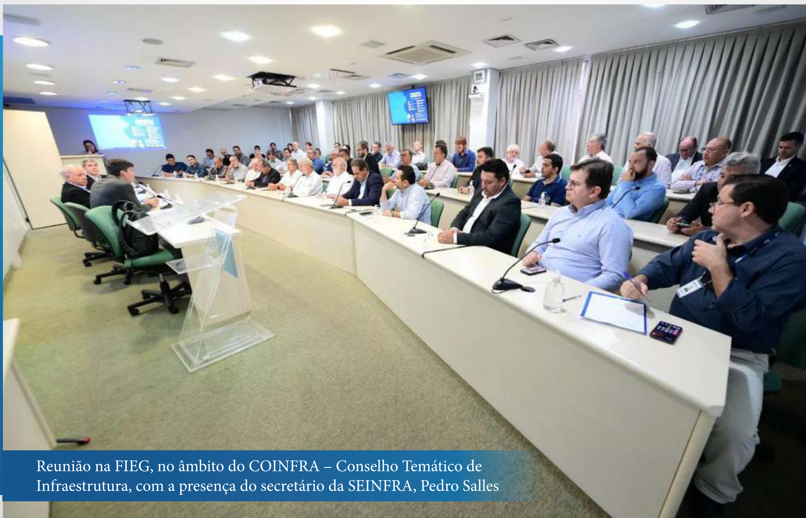
Reunião na FIEG, no âmbito do COINFRA – Conselho Temático de Infraestrutura, com a presença do secretário da SEINFRA, Pedro Salles

O presidente do Sinduscon-GO propôs ao secretário que o governo do estado estabeleça um “pai da criança” para as tratativas do Anel Viário, avaliando que o assunto está pulverizado entre várias autoridades públicas e entidades. Cezar Mortari propôs como nomes o próprio Pedro Salles ou o vice-governador Daniel Vilela.