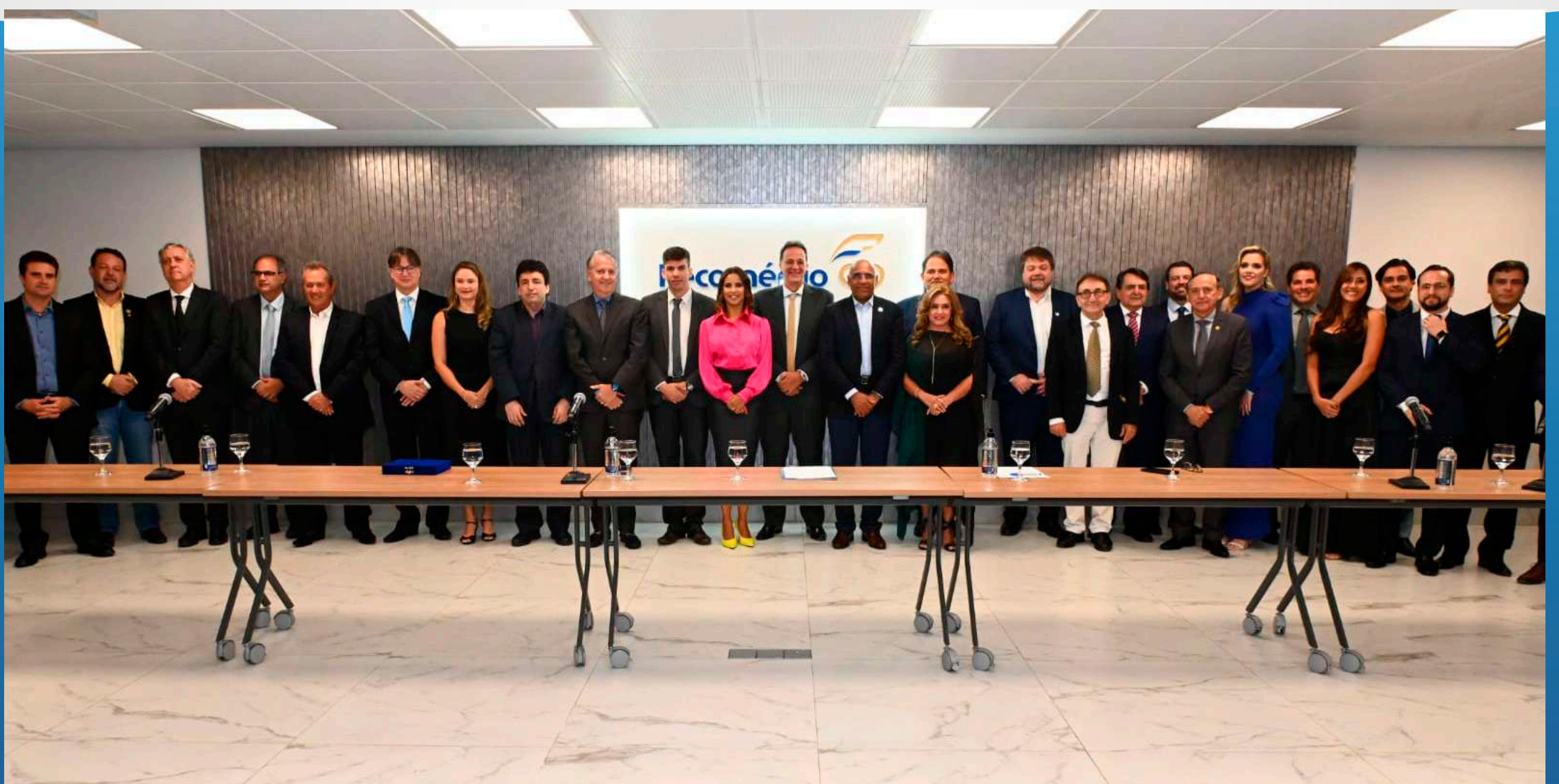
Representantes do Sinduscon-GO na solenidade de posse da nova diretoria do CODESE