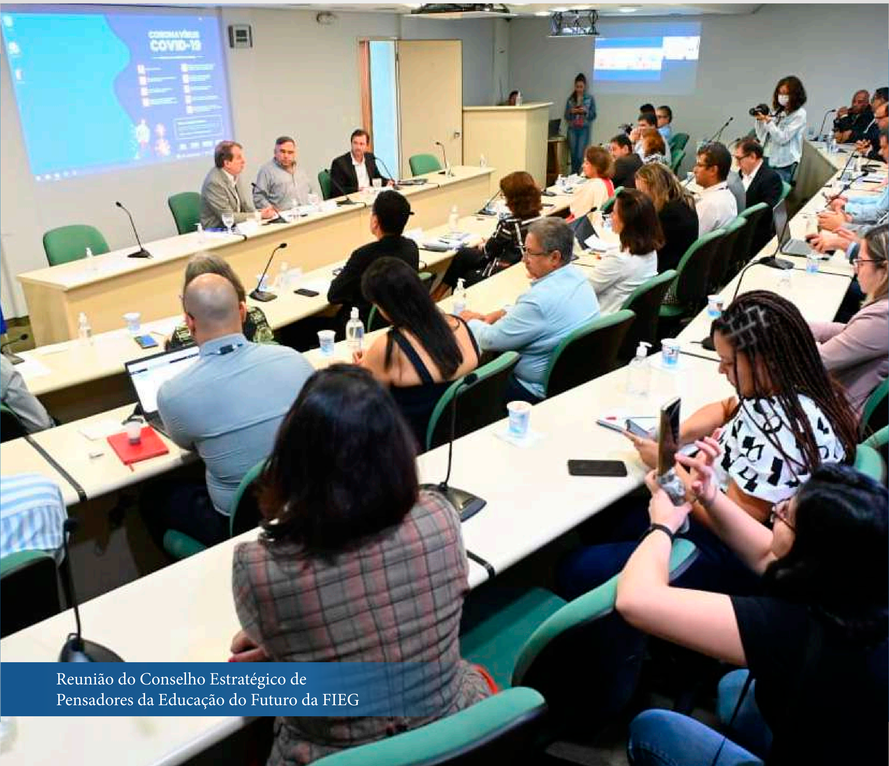
Reunião do Conselho Estratégico de Pensadores da Educação do Futuro da FIEG