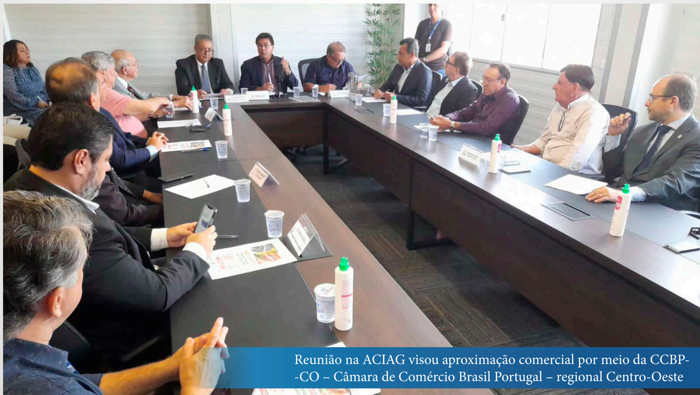
Reunião na ACIAG visou aproximação comercial por meio da CCBP-CO – Câmara de Comércio Brasil Portugal – regional Centro-Oeste

Nessa primeira ação vislumbrou-se exportação de produtos farmoquímicos e de vestuário por parte de Aparecida de Goiânia. Os visitantes convidaram para investimento brasileiro no mercado imobiliário português, tendo em vista, segundo eles, a grande pressão por moradia em Portugal, pois os custos de construção em outros países europeus estão bem maiores, havendo, portanto, uma migração para Portugal.