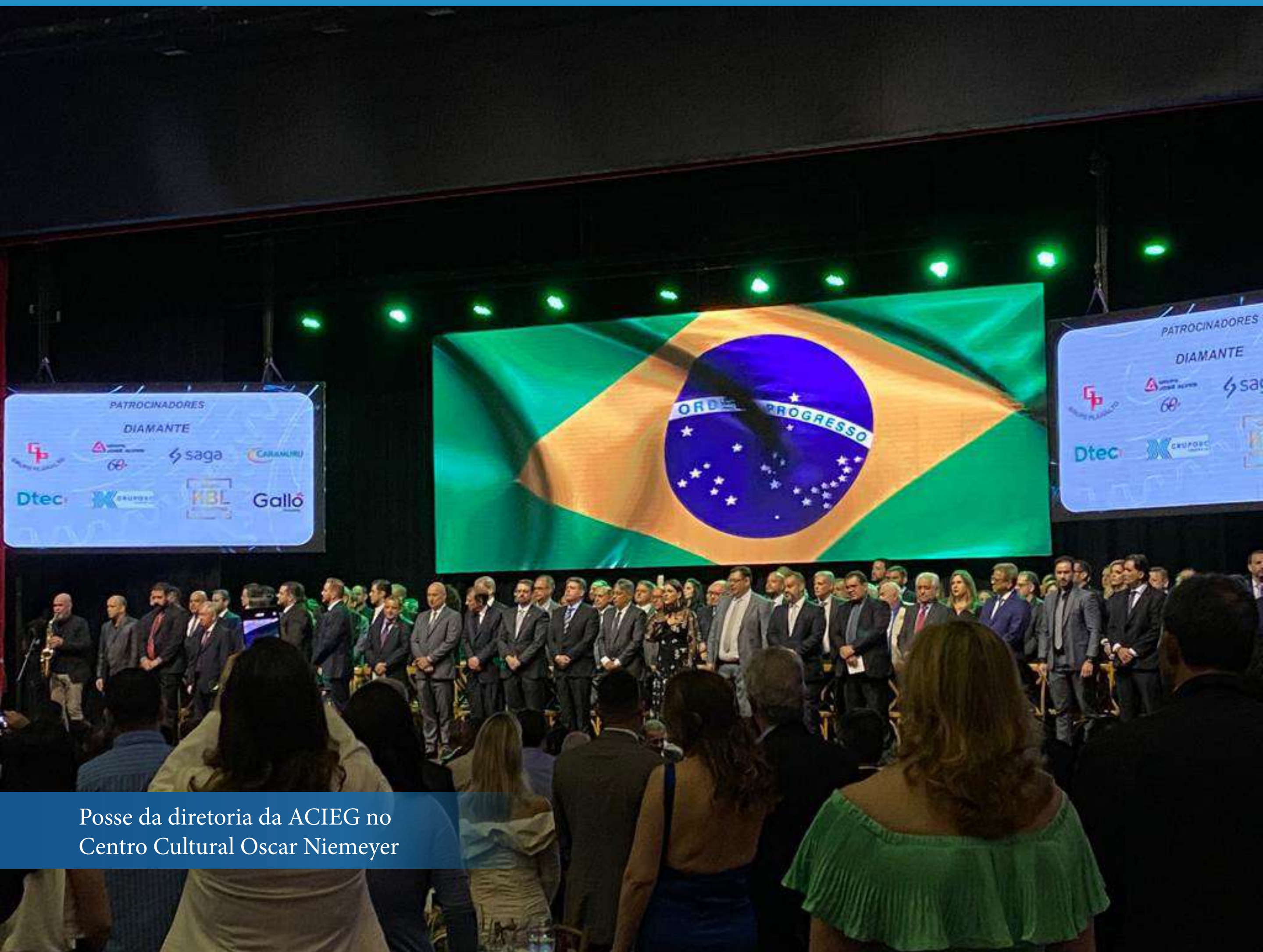
Posse da diretoria da ACIEG no Centro Cultural Oscar Niemeyer