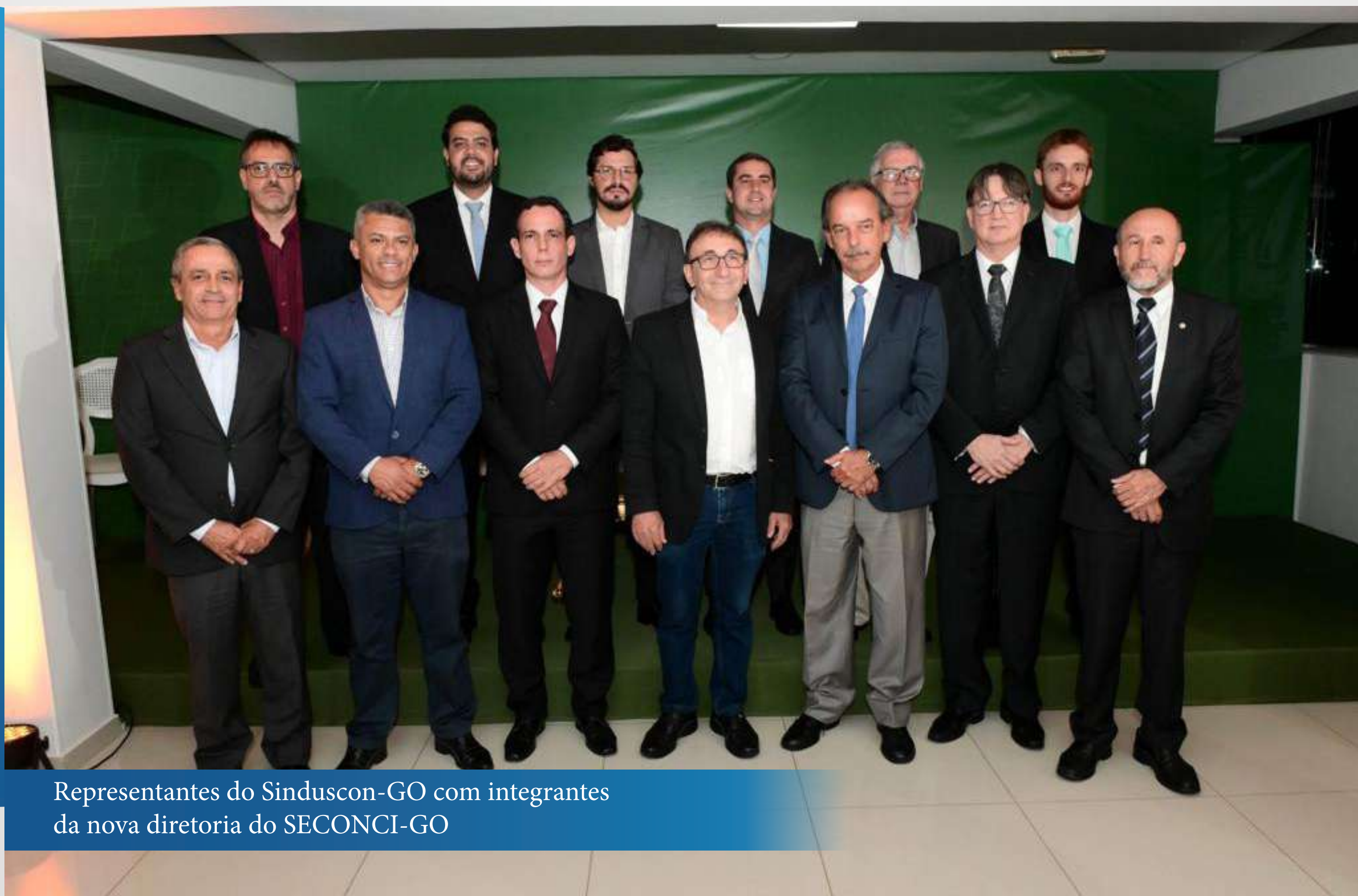
Representantes do Sinduscon-GO com integrantes da nova diretoria do SECONCI-GO