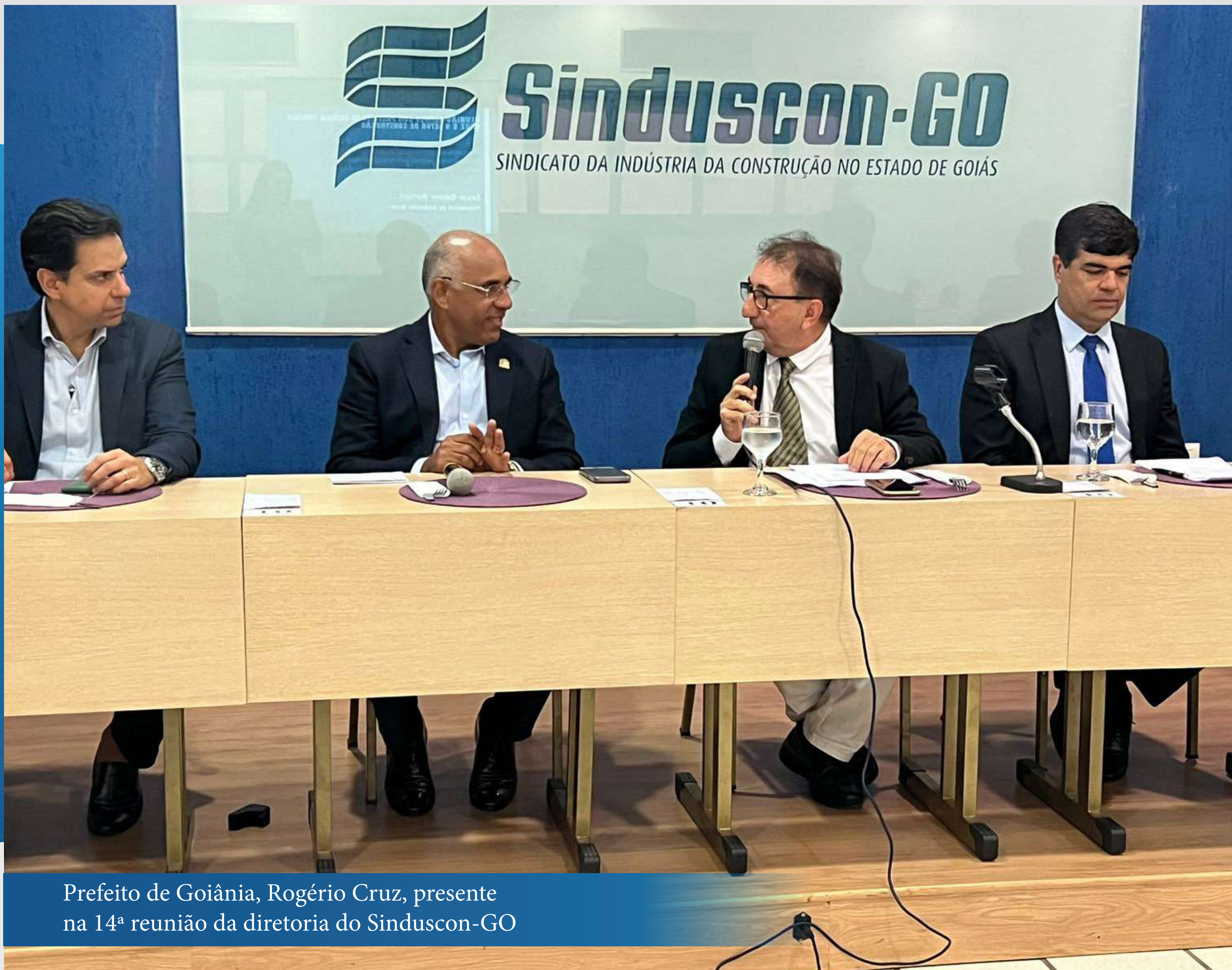
Prefeito de Goiânia, Rogério Cruz, presente na 14ª reunião da diretoria do Sinduscon-GO