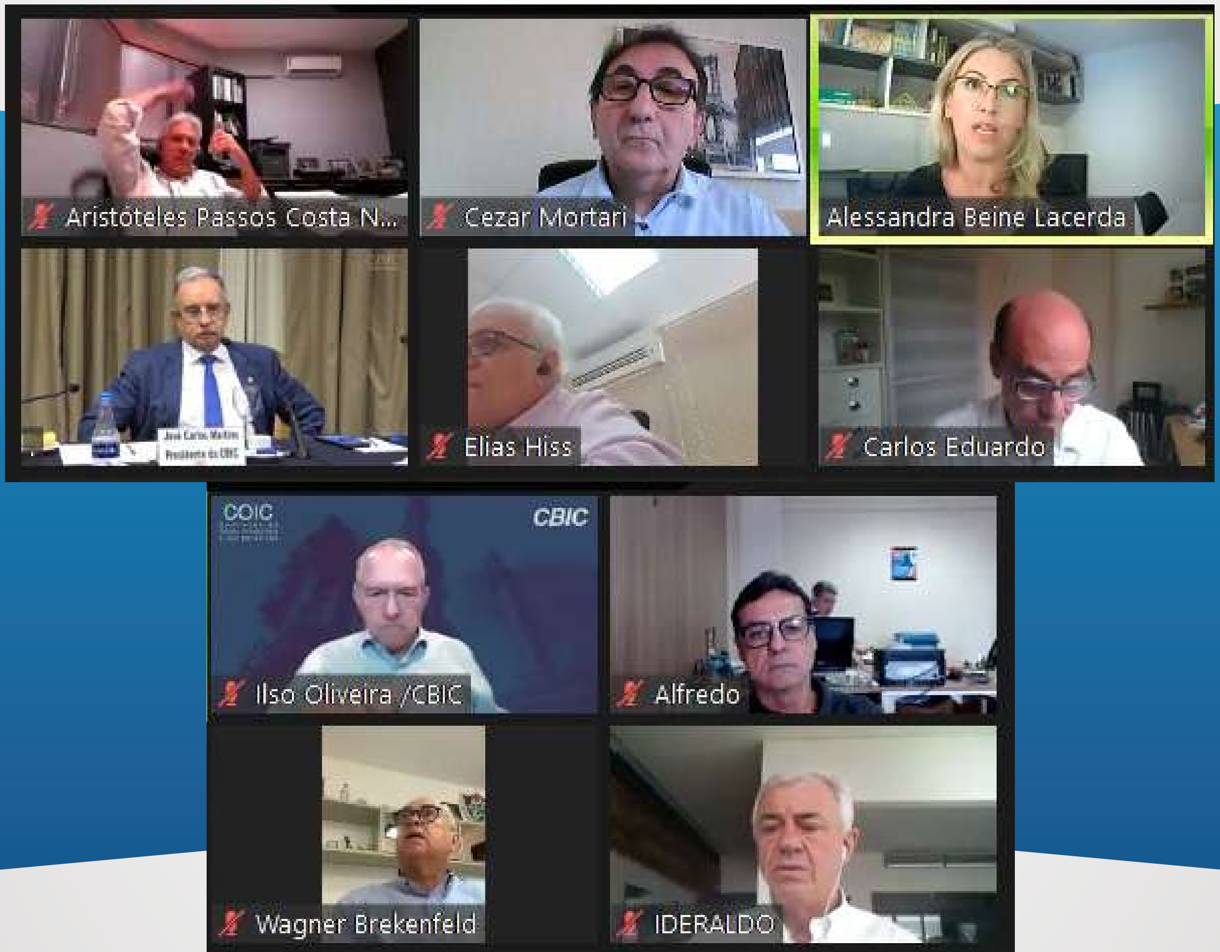
Reunião do Conselho da Câmara Brasileira da Indústria da Construção (CBIC)

No encontro foram tratadas as diretrizes de atuação da CBIC em 2023, com especial atenção ao novo programa MCMV – Minha Casa Minha Vida; verbas para Infraestrutura; a questão dos juros altos e seus possíveis reflexos no mercado imobiliário; a escassez de mão de obra e a programação avançada do ENIC – Encontro Nacional da Indústria da Construção, que será realizado entre 12 e 14 de abril, juntamente com a FEICON, no Expo Center Norte em São Paulo.