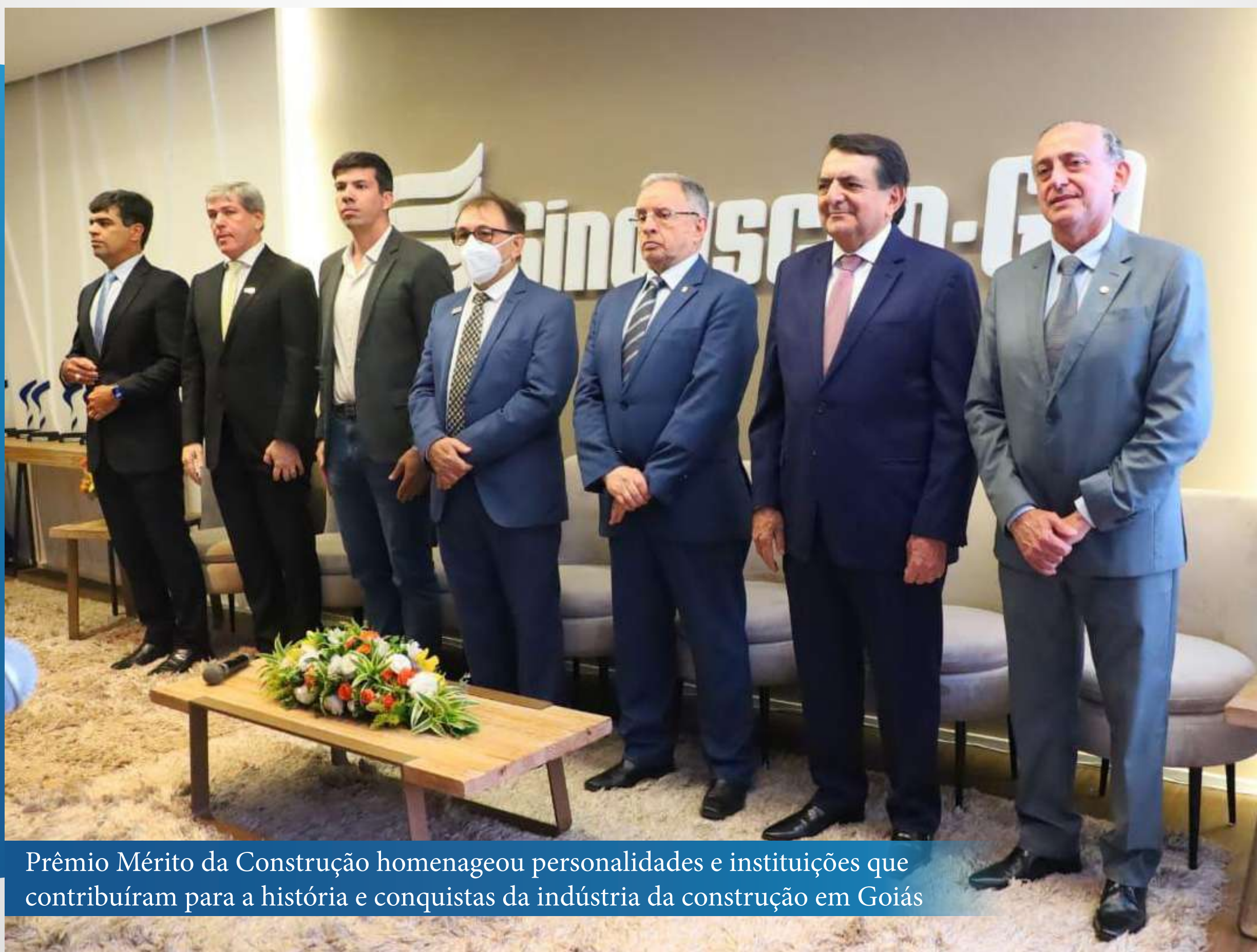
Prêmio Mérito da Construção homenageou personalidades e instituições que contribuíram para a história e conquistas da indústria da construção em Goiás

O Prêmio Mérito da Construção contou com apoio da Metalforte, Mútua Goiás - Caixa de Assistência dos Profissionais do CREA, SICCOOB Engecred, Brasal Incorporações, Senior Globaltec, Arthur Rios Advogados Associados, Ciplan, Gerdau, Joule Engenharia e Leinertex