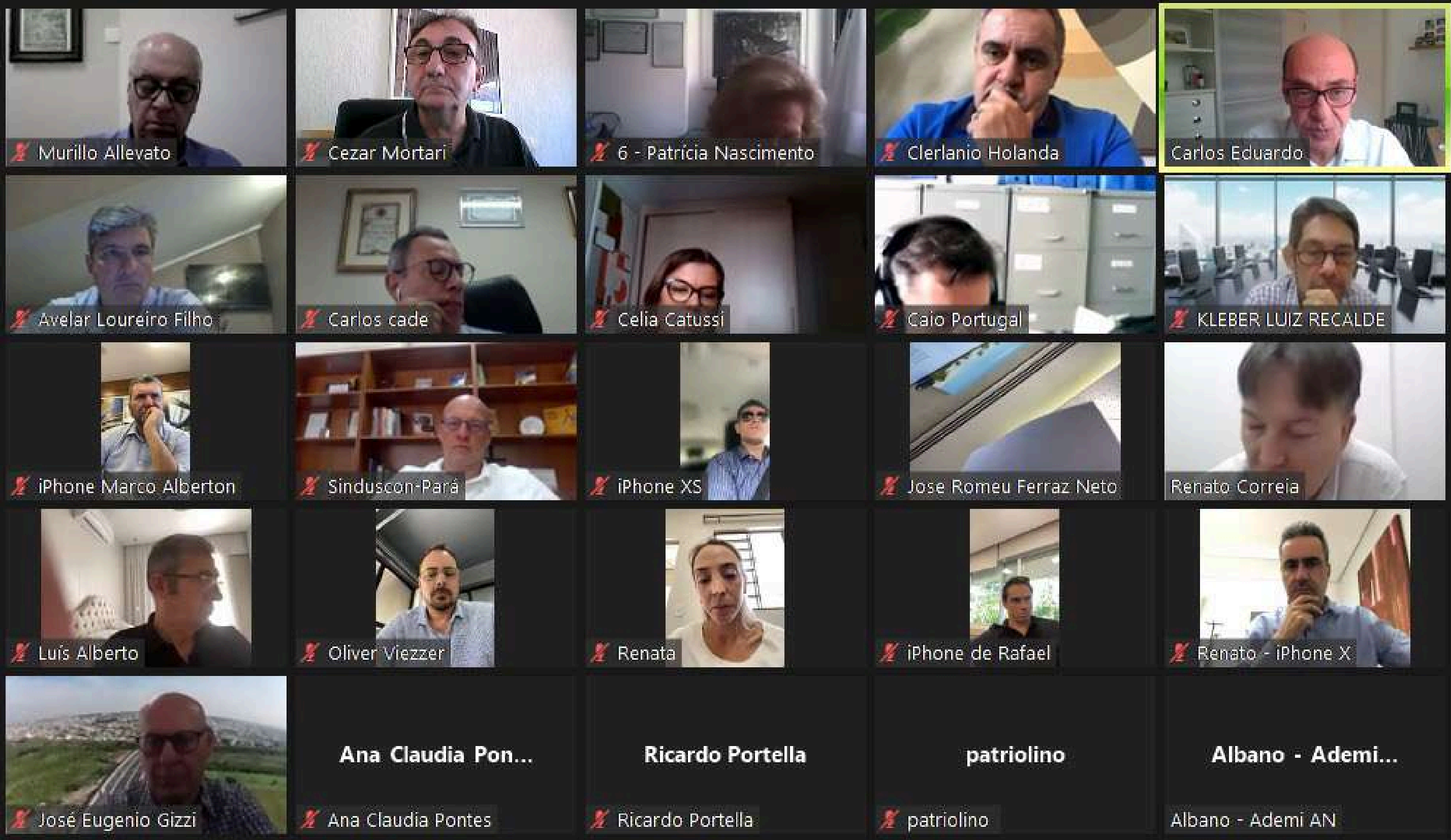
Reunião online alinhou expectativas e agenda dos principais diretores da nova diretoria da CBIC