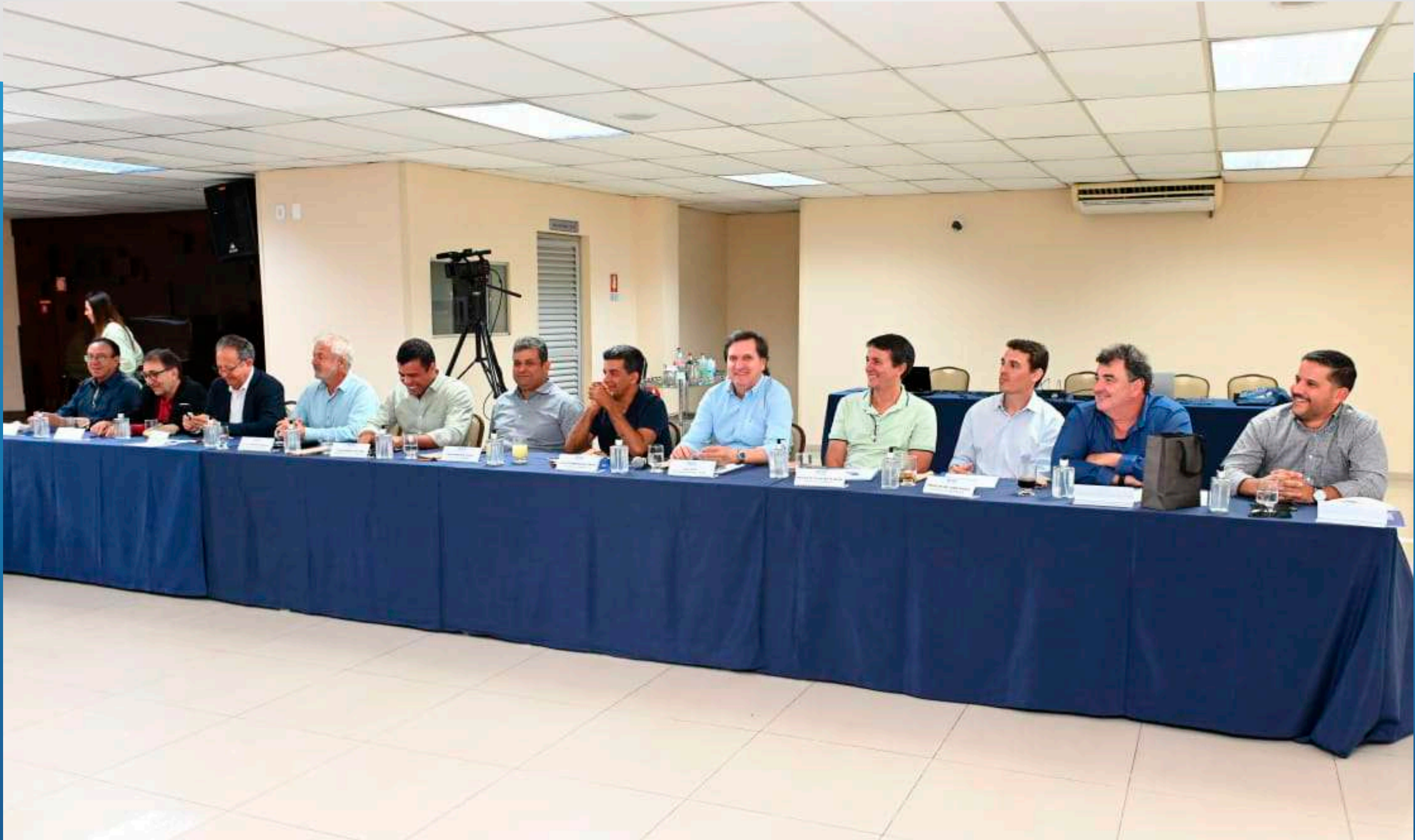
Reunião do Conselho da FIEG debateu a agenda da indústria e evidenciou a preocupação do setor de construção com as definições da Reforma Tributária