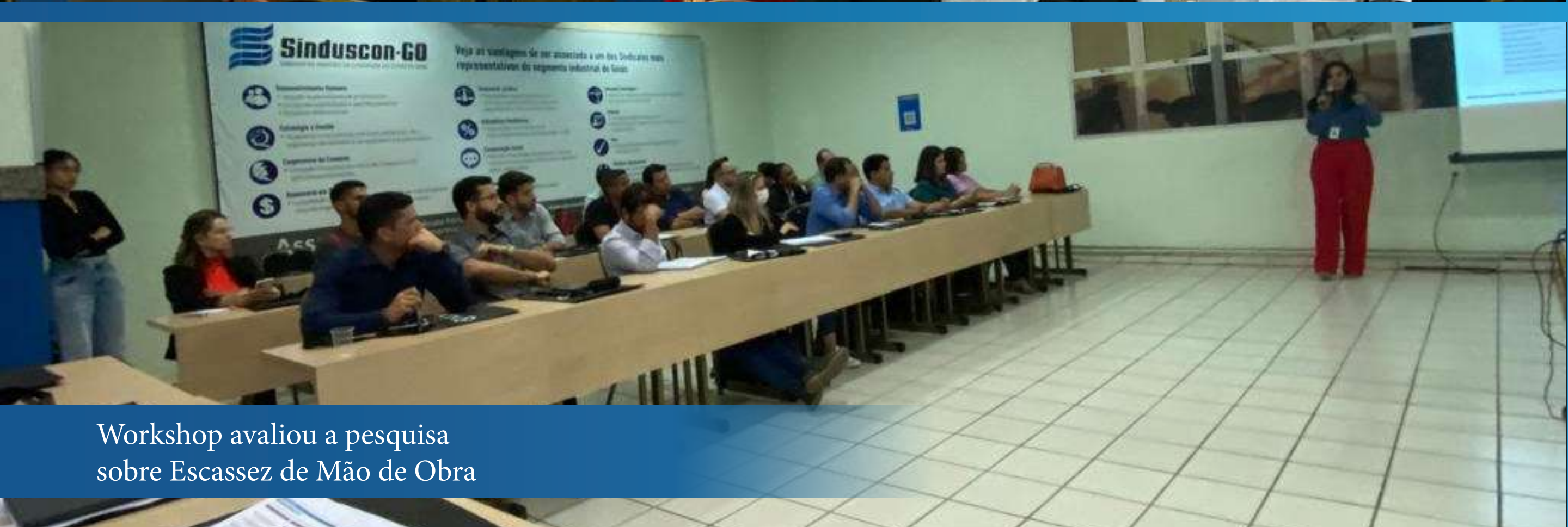
Workshop avaliou a pesquisa sobre Escassez de Mão de Obra